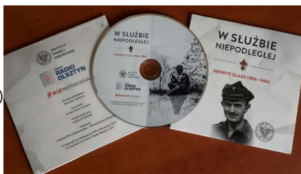
CD: W służbie Niepodległej. Henryk Glass (1896–1984)