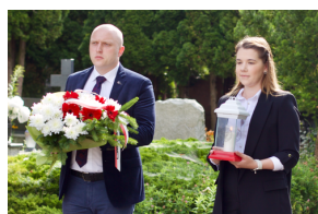
11 lipca obchodzimy Narodowy Dzień Pamięci Ofiar Ludobójstwa dokonanego przez ukraińskich nacjonalistów na obywatelach II Rzeczypospolitej Polskiej. Łukasz