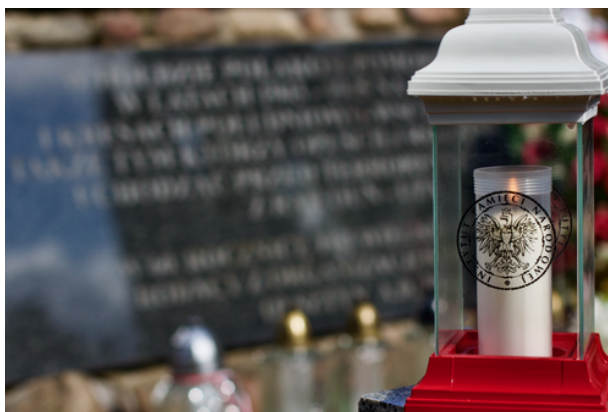
11 lipca obchodzimy Narodowy Dzień Pamięci Ofiar Ludobójstwa dokonanego przez ukraińskich nacjonalistów na obywatelach II Rzeczypospolitej Polskiej.

Tego samego dnia w Gietrzwałdzie odbył się wernisaż wystawy „Sąsiedzka krew. Ludobójstwo wołyńsko-galicyjskie 1943-1945”, która znajduje się w Gietrzwałdzie, przed budynkiem urzędu gminy. Wystawa będzie prezentowana do końca lipca.