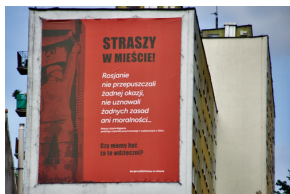
Akcja informacyjna „Straszy w Mieście” Łukasz Czechyra /IPN