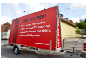
Akcja informacyjna „Straszy w Mieście”