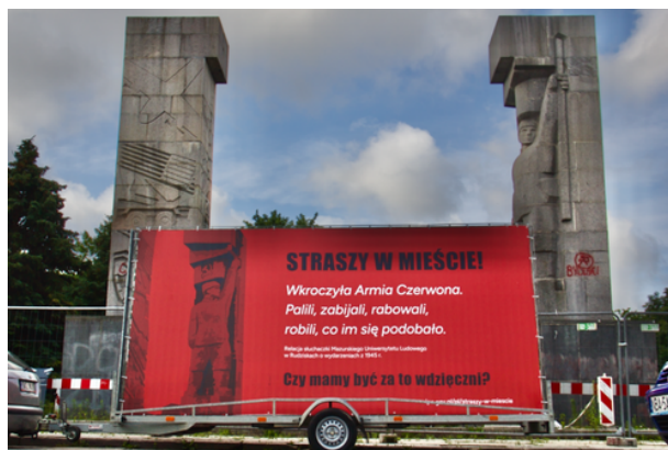
Akcja informacyjna „Straszy w Mieście” Łukasz Czechyra /IPN

Popularne „szubienice” zostały odsłonięte w 1954 r. jako pomnik Wdzięczności Armii Czerwonej. Nie jest to jednak pomnik, który upamiętnia prawdziwe wydarzenia, lecz komunistyczny obiekt propagandowy. Fałszuje on historię i próbuje wmawiać mieszkańcom i odwiedzającym, że zajęcie miasta i całego regionu przez Sowieców było „chwalebnym wyzwoleniem”, a nie tym, czym było w rzeczywistości - pasmem terroru i zbrodni.