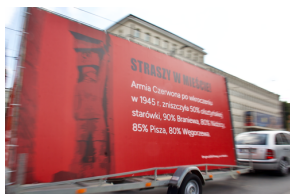
Akcja informacyjna „Straszy w Mieście”