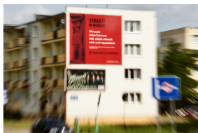
Akcja informacyjna „Straszy w Mieście” Łukasz Czechyra /IPN