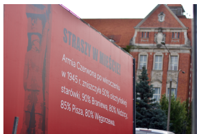
Akcja informacyjna „Straszy w Mieście”