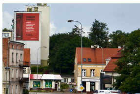
Akcja informacyjna „Straszy w Mieście”