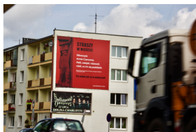
Akcja informacyjna „Straszy w Mieście”