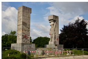
Akcja informacyjna „Straszy w Mieście”

Więcej informacji o akcji można znaleźć TUTAJ .