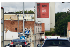
Akcja informacyjna „Straszy w Mieście”