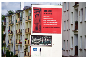
Akcja informacyjna „Straszy w Mieście”