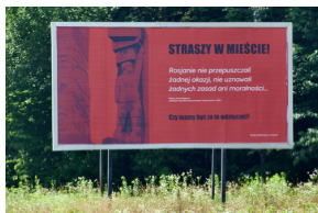
Akcja informacyjna „Straszy w Mieście”