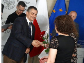
W drugiej edycji projektu pt. „Przez historię z Niezwyciężonymi” brało udział blisko 8 tysięcy uczniów.