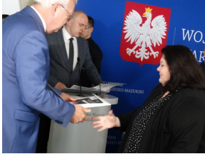
W drugiej edycji projektu pt. „Przez historię z Niezwyciężonymi” brało udział blisko 8 tysięcy uczniów.