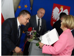
W drugiej edycji projektu pt. „Przez historię z Niezwyciężonymi” brało udział blisko 8 tysięcy uczniów.