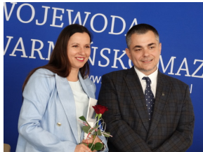
W drugiej edycji projektu pt. „Przez historię z Niezwyciężonymi” brało udział blisko 8 tysięcy uczniów.