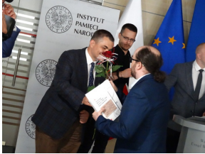
W drugiej edycji projektu pt. „Przez historię z Niezwyciężonymi” brało udział blisko 8 tysięcy uczniów.