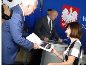
W drugiej edycji projektu pt. „Przez historię z Niezwyciężonymi” brało udział blisko 8 tysięcy uczniów.