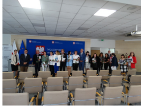
W drugiej edycji projektu pt. „Przez historię z Niezwyciężonymi” brało udział blisko 8 tysięcy uczniów. Bartłomiej Zaremba/IPN Olsztyn