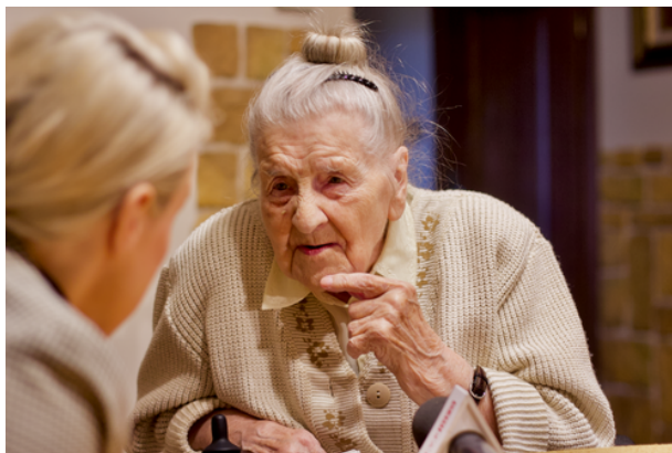
Odznaczenie zostało przyznane 5 kwietnia