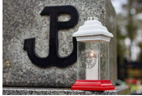
Uroczystości odbyły się pod pomnikiem Armii Krajowej w Olsztynie