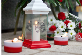
Uroczystości odbyły się pod pomnikiem Armii Krajowej w Olsztynie