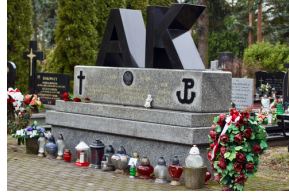
Pomnik poświęcony poległym żołnierzom AK na olsztyńskim cmentarzu