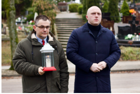
Uroczystości odbyły się pod pomnikiem Armii Krajowej w Olsztynie