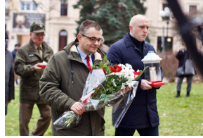
Uroczystości odbyły się pod pomnikiem Armii Krajowej w Olsztynie