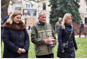
Uroczystości odbyły się pod pomnikiem Armii Krajowej w Olsztynie