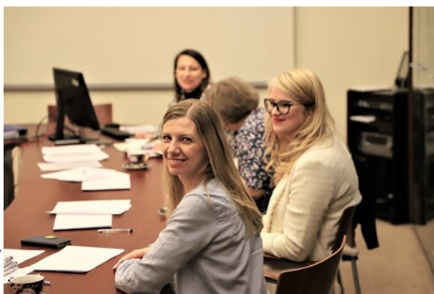
Obrady jury