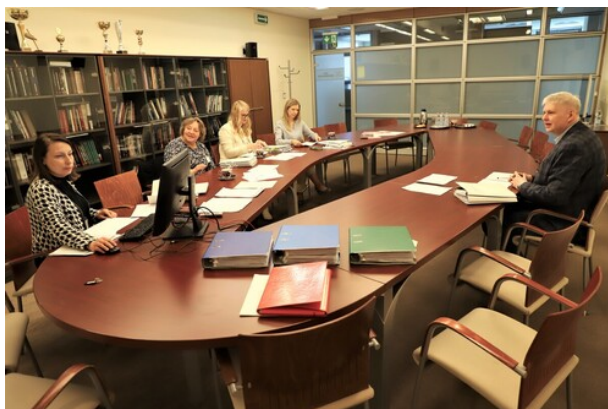
Obrady jury, fot. Natalia Krzywicka IPN