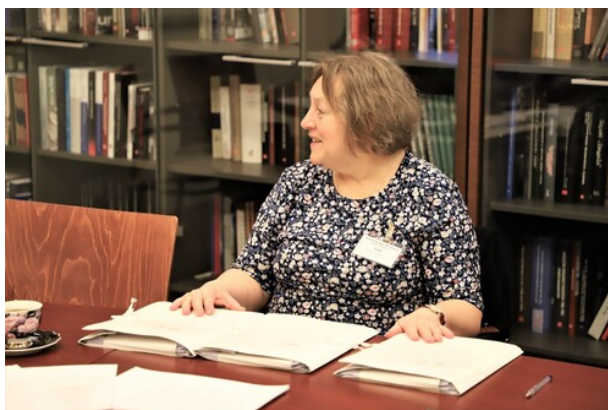
Obrady jury