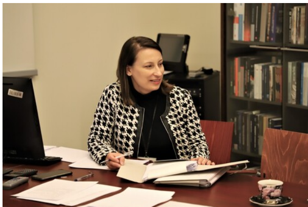
Obrady jury, fot. Natalia Krzywicka IPN

(Katolicka Szkoła Podstawowa im. Matki Bożej Miłosierdzia w Białymstoku)