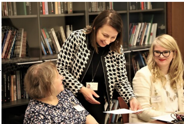
Obrady jury