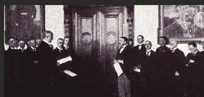
Oficjalne przekazanie terenu plebiscytowego administracji niemieckiej w gmachu rejencji olsztyńskiej, VIII 1920 r.

Wszelkie próby propolskiej działalności były ograniczane lub likwidowane przez administrację i stosujące terror bojówki niemieckie, co znacząco przyczyniło się do zmniejszenia zasięgu oddziaływania. Tego typu zachowania strony niemieckiej powodowały, że szanse Polski w plebiscycie coraz bardziej się zmniejszały. Stan ten utrzymał się aż do dnia głosowania - 11 lipca 1920 r., kiedy to w okręgu olsztyńskim na Prusy Wschodnie oddano 363 209 głosów, a na Polskę 7980. Wynik ten oznaczał, że do Polski przyłączono tylko trzy wsie z ówczesnego powiatu ostródzkiego tj. Groszki, Lubstynek i Napromek. Plebiscyt choć przegrany, to jednak naznaczony fałszerstwami wyborczymi i kontrolą głosowania przez żandarmów niemieckich, uświadomił opinii międzynarodowej istnienie kwestii polskiej w Prusach Wschodnich.