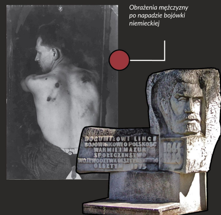
Obrażenia mężczyzny po napadzie bojówki niemieckiej