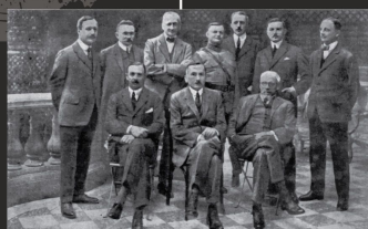
Komitet Narodowy Polski. Siedzą od lewej: Maurycy Zamojski, Roman Dmowski, Erazm Piłtż

Mimo to działacze polscy latem 1919 r. powołali Mazurski Komitet Plebiscytowy i Warmiński Komitet Plebiscytowy, które miały koordynować działania strony polskiej. Z miesiąca na miesiąc polska akcja propagandowa na terenach plebiscytowych przybierała na sile. Zaczęto prowadzić kursy agitatorów i kolportować prasę, a w listopadzie 1919 r. powstał Mazurski Związek Ludowy stawiający sobie za cel uświadamianie ludności mazurskiej.