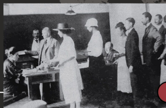
Dzień głosowania, 11 VII 1920 r.